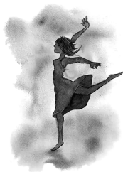
你所看到的惊艳, 都曾被平庸历练。