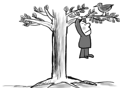
一只站在树上的鸟儿,从来不害怕树枝断裂,因为它相信的不是树枝,而是翅膀。

①不要人夸好颜色,只留清气满乾坤 ②宝剑锋从磨砺出,梅花香自苦寒来 ③独立自强任风雨,无惧艰辛心永豪 ④荆棘丛中练内功,勇往直前任征程