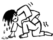
成功不过是 站起比倒下多一次

10. 2023年12月22日,第78届联合国大会协商一致通过决议,将中国春节(农历新年)确定为联合国假日。春节作为中国传统民俗节日,承载着家庭和睦、社会包容、人与自然和谐共生等全人类共同价值。许多国家和地区把春节作为法定节假日,全球约五分之一的人口以不同形式庆祝春节。对此理解正确的是 ( )